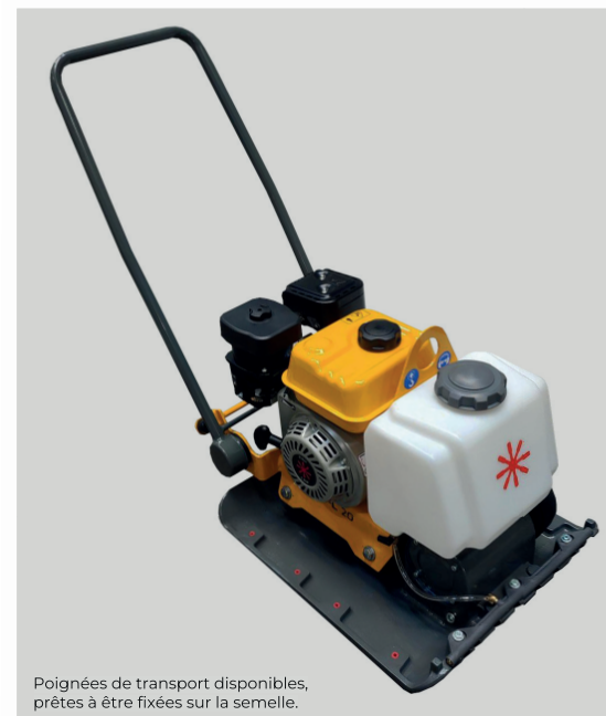
Poignées de transport disponibles, prêtes à être fixées sur la semelle.